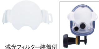
減光フィルター装着例