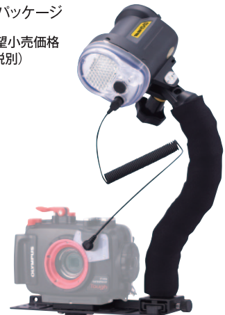
他社製ハウジング装着例