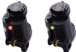
レディ(チャージ完了)の 状態